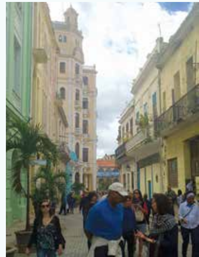
Street Scene