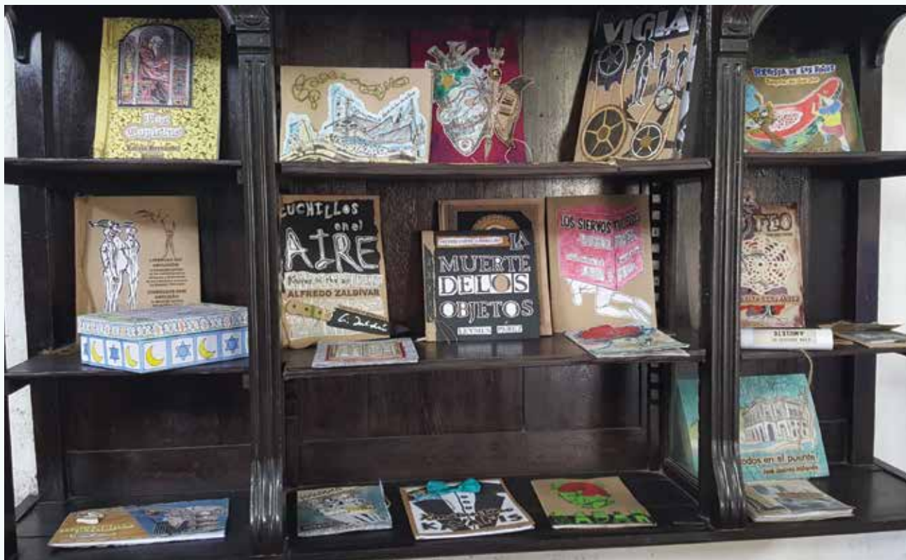
Handmade books for sale at Ediciones Vigía in Matanzas