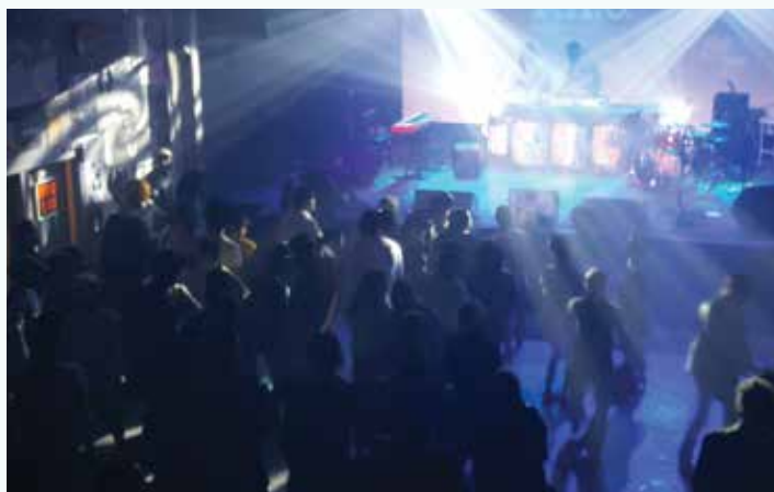
In January, Fabrica de Arte Cubano hosted a party in honor of Spotify's annual worldwide staff meeting. Visitors took in sights and sounds of something familiar to Clevelanders—the adaptive re-use of former industrial space by artists. In this case, the FAC—a former cooking oil factory—has been converted into an exhibit hall/performance space and nightclub, featuring art, video projection, DJs, and bands.