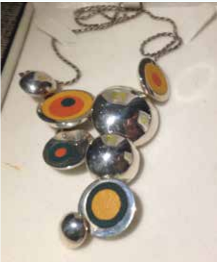
Necklace by Yasniel Valdes