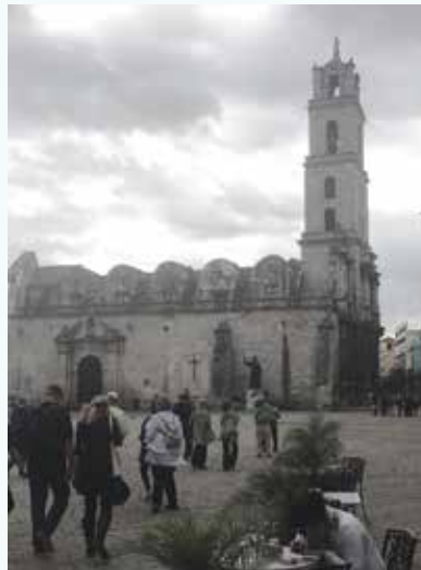
Old fort