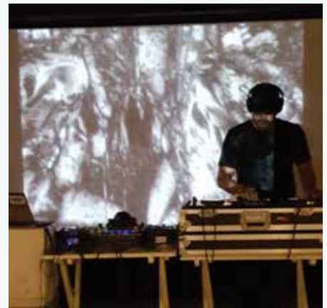
ABOVE & BELOW: Art at Fabrica de Arte Cubano