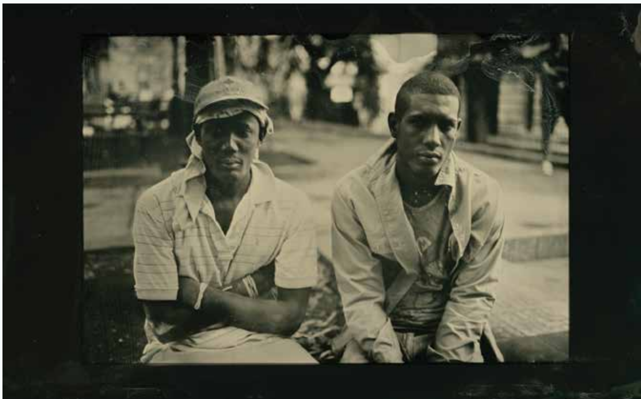
Olney & Lagano, Old Havana. Tintype photo by Greg Martin, 2017.