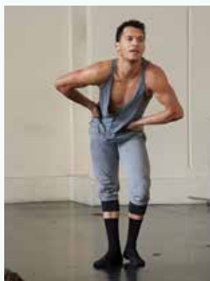
Soloist with Malpaso